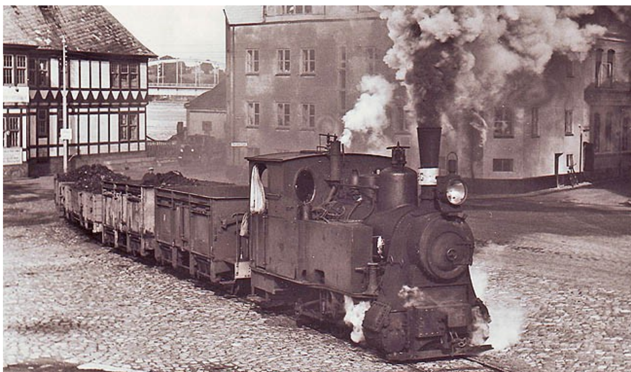
... For fuld damp forbi dampskibspavillonen