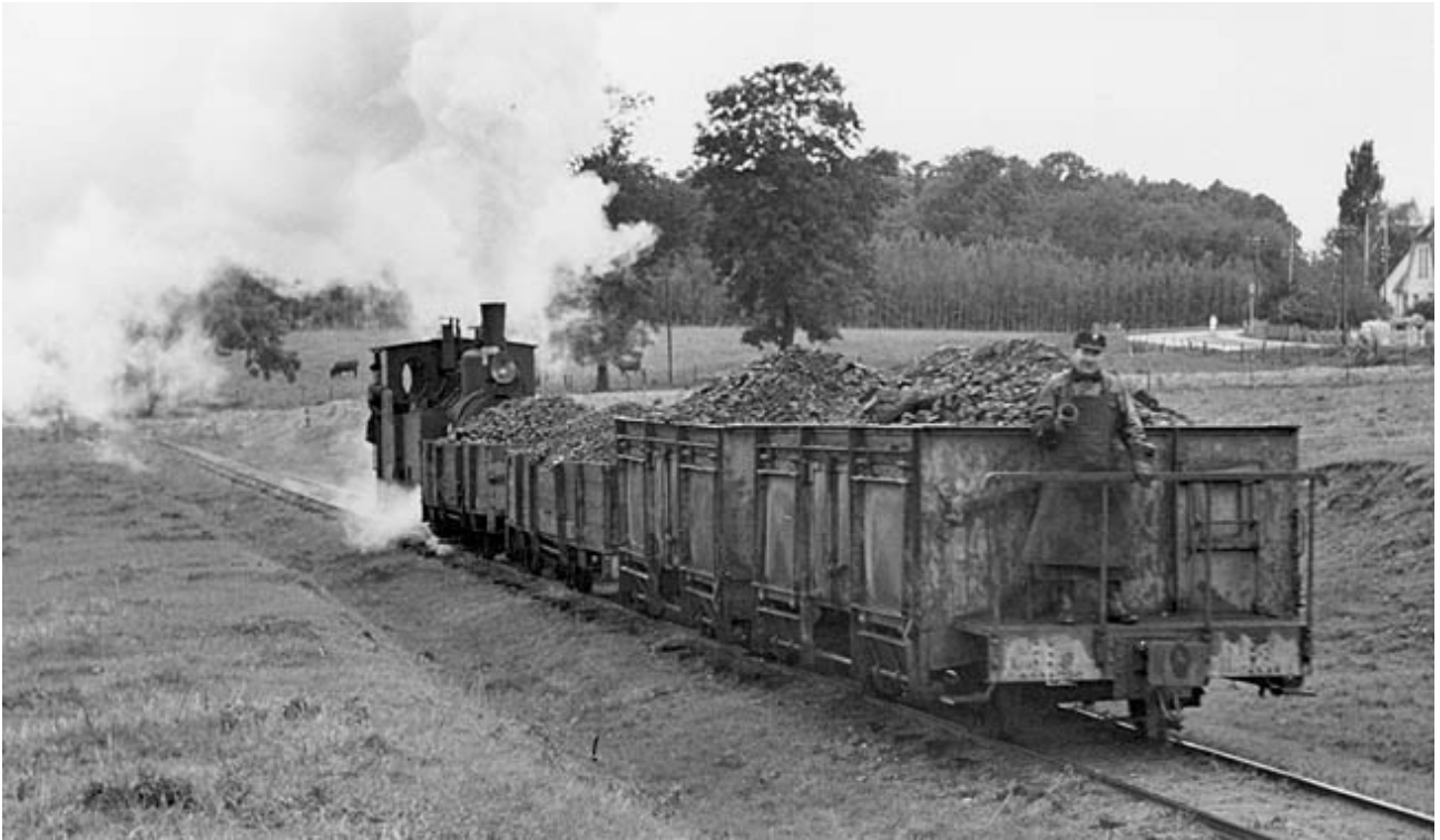
.. Vognene blev skubbet det sidste stykke mod Ladegaard