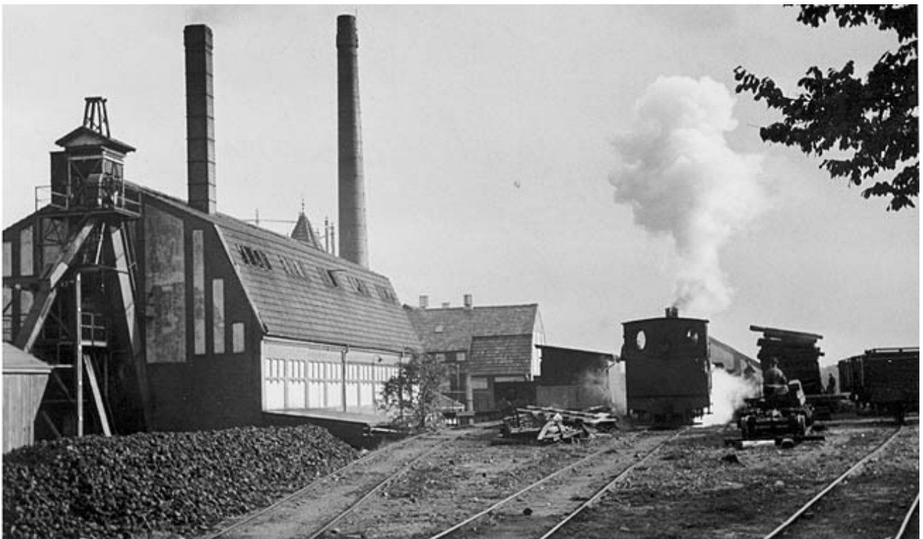
.. Ankommet til kulpladsen ved gasværket ved Ladegaard