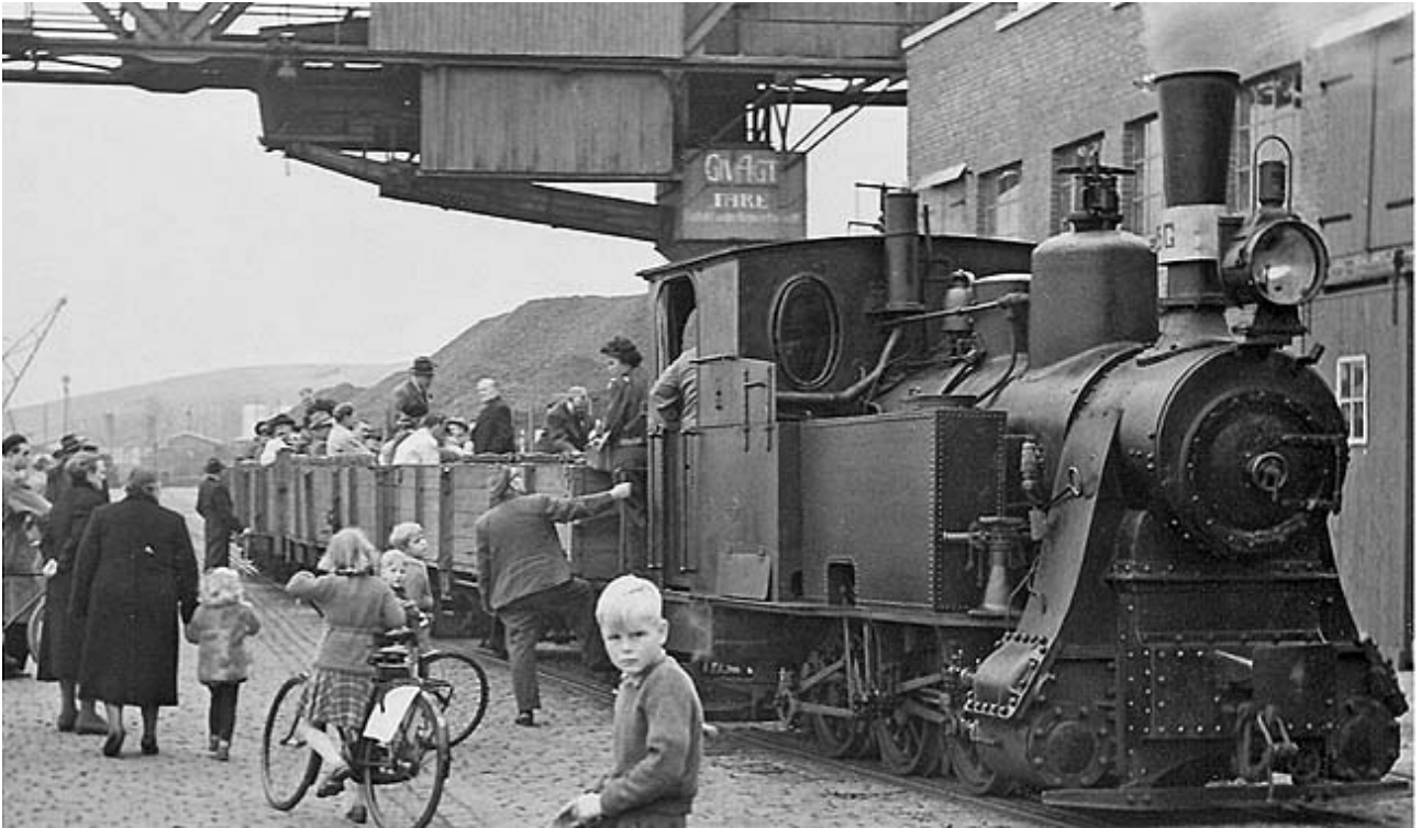
.. Der gøres klar til sidste tur til gasværket før nedlæggelsen i 1951.